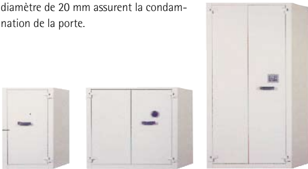
AF II est disponible en 3 volumes.

AF II est disponible en 3 volumes. Conçue pour apporter une capacité de stockage maximale, elle possède un espace intérieur entièrement modulable. Pour un accès total, les portes peuvent s'ouvrir jusqu'à 180°. AF II est conçue en tôle d'acier 20/10e, les portes sont à doubles parois d'une épaisseur de 65 mm. Quatre pènes cylindriques d'un diamètre de 20 mm assurent la condamnation de la porte.